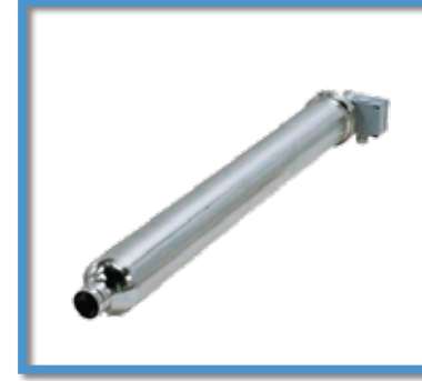
Módulos para aumento de presión GRUNDFOS