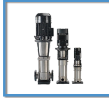
Bombas multietapas verticales GRUNDFOS