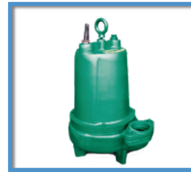
Sumergible para lodos BARMESA