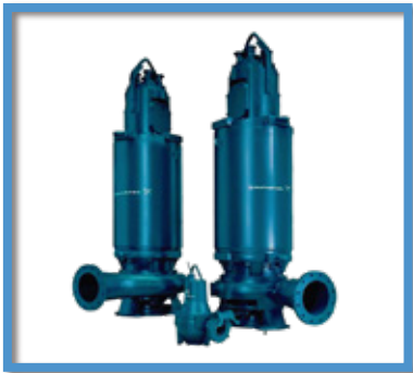
Sistema de agua residual o pluvial GRUNDFOS