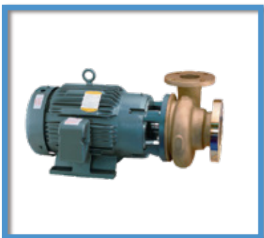
Bombas marinas industriales AMPCO