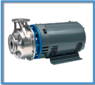
Bombas centrífugas GOULDS