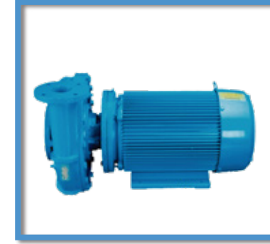
Bombas HVAC GRUNDFOS