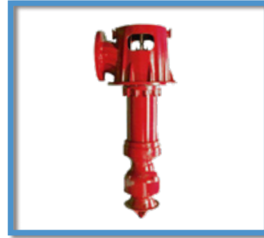
Bombas contra incendios PEERLESS