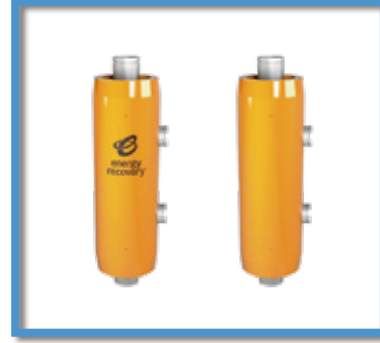
Sistema de agua residual o pluvial ENERGY RECOVERY